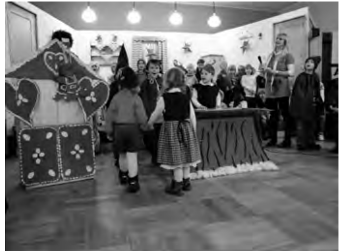
Hänsel und Gretel

Viele fleißige Helfer bewirteten unsere Gäste, halfen bei den Vorbereitungen oder stellten Selbstgebackenes zur Verfügung. Dem Elternrat, allen helfenden Vatis, Muttis oder